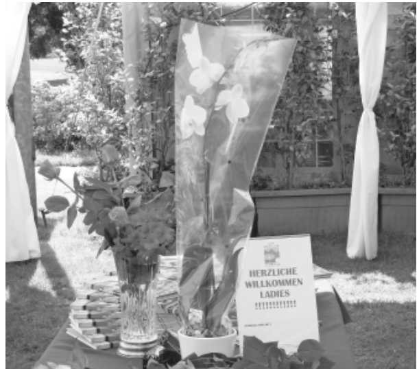
Empfang in Verbania mit 26 Rosen

sehr lang. Wir sind uns alle einig und froh, dass wir die Platzreife und das Handicap nicht hier erspielen mussten. Schon wieder erleben wir einen lauen Abend. Wir tuckern mit dem Tuckerboot unter dem Kommando unseres lustigen und doch etwas kuriosen Kapitäns zur Isola Pescatori. Mit Hilfe eines kühlen Apéros erholen wir uns vom Sightseeingtrip um die Insel, bevor wir mit einem tollen Fischgericht verköstigt werden.