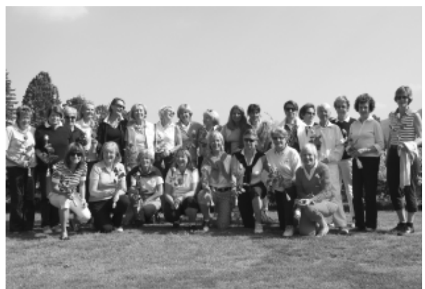
Gruppenbild mit Rosen